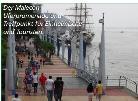
Der Malecon. Uferpromenade und Treffpunkt für Einheimische und Touristen.

Für ausländische Unternehmen spielt natürlich die Frage der Investitionssicherheit eine ganz wesentliche Rolle: „Prinzipiell gehen wir nicht davon aus, dass ausländische Investoren Probleme bekommen, die wie die Life Forestry Group in Aktivitäten investiert, die in Übereinstimmung mit den hie-