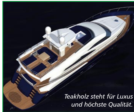
Teakholz steht für Luxus und höchste Qualität.

Der Teakbaum wächst nur in den Tropen. Die Aufforstungsfläche wird auf rund 1,1 Millionen Hektar weltweit geschätzt. Die wilde Abholzung der natürlichen Teakbaum-Bestände ist durch Umweltinitiativen rückläufig. Der Zeitraum zwischen Aufforstung und Abholzung in Plantagen beträgt bis zu 50 Jahre.