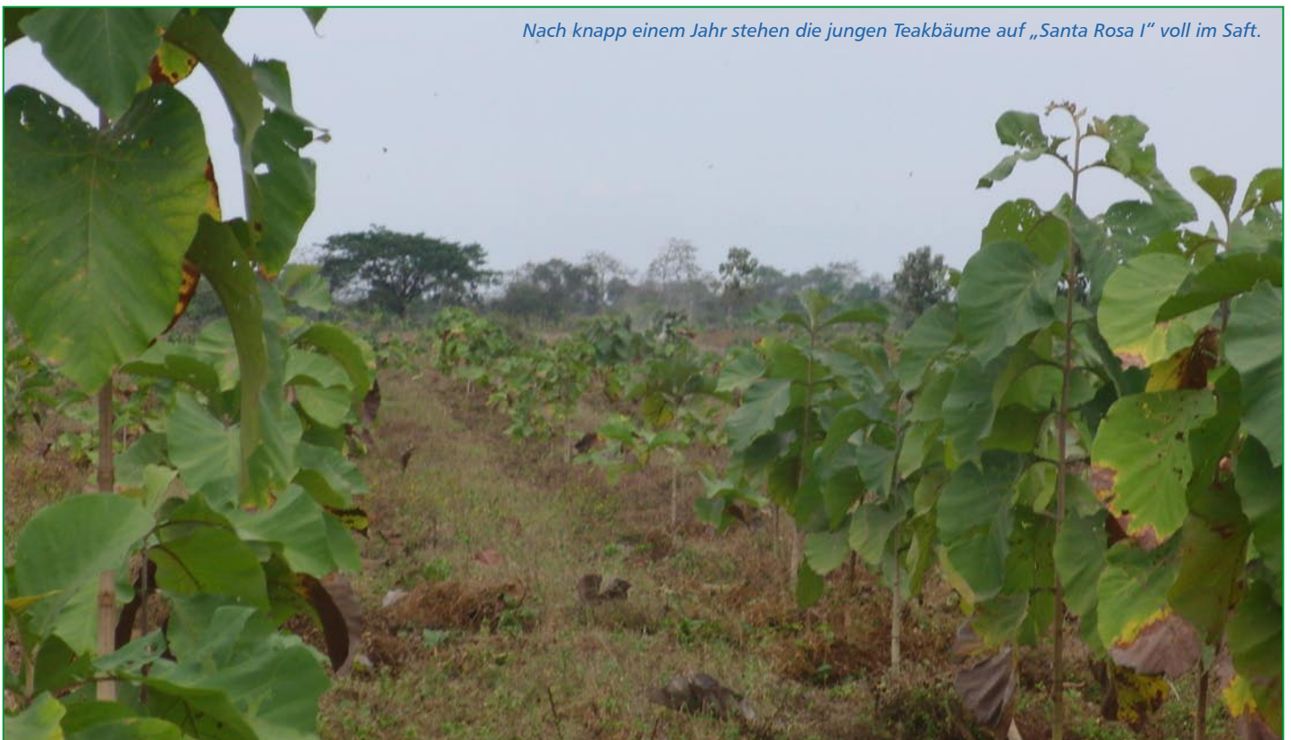
Nach knapp einem Jahr stehen die jungen Teakbäume auf „Santa Rosa I“ voll im Saft.