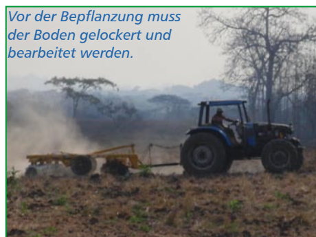
Vor der Bepflanzung muss der Boden gelockert und bearbeitet werden.

Die Voraussetzungen in der Region Balzar sind bekanntermassen hervorragend. Das perfekte Zusammenspiel von Bodenqualität und klimatischen Voraussetzungen ermöglicht ein überdurchschnittliches Wachstum.