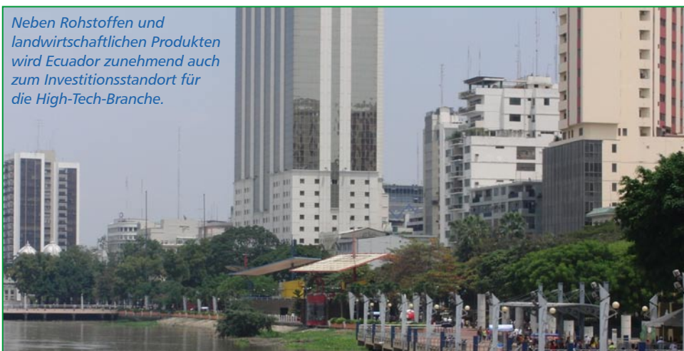
Neben Rohstoffen und landwirtschaftlichen Produkten wird Ecuador zunehmend auch zum Investitionsstandort für die High-Tech-Branche.

Enteignungen ohne die entsprechende Begründung und angemessene Entschädigung sind in Ecuador grundsätzlich verboten, sowohl durch die momentane Gesetzgebung, als auch im erwähnten neuen Gesetz.