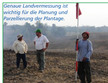
Genau Landvermessung ist wichtig für die Planung und Parzellierung der Plantage.