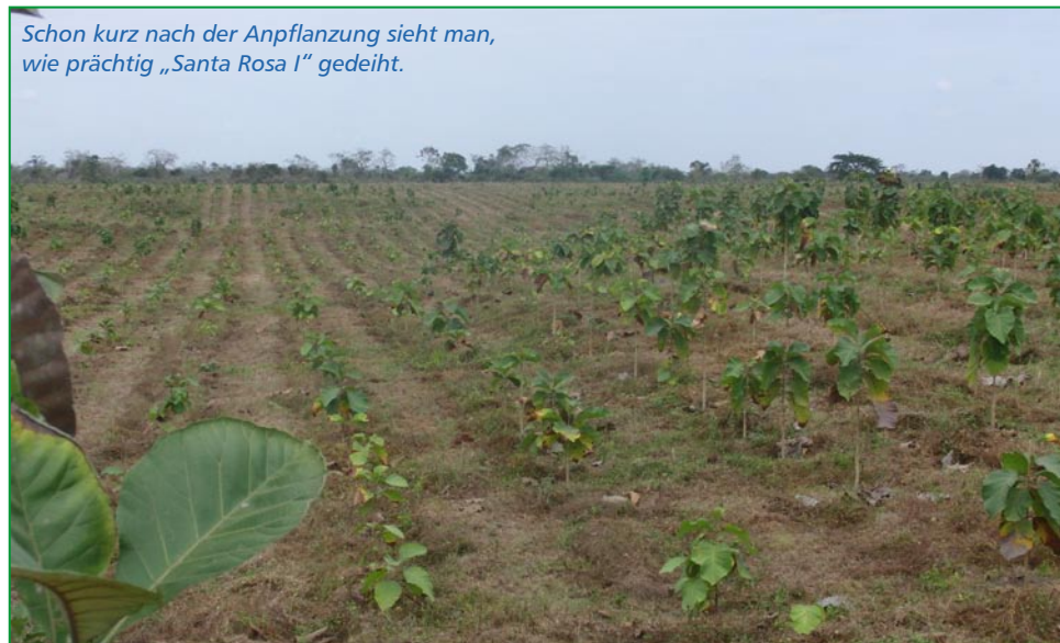
Schon kurz nach der Anpflanzung sieht man, wie prächtig „Santa Rosa I“ gedeiht.