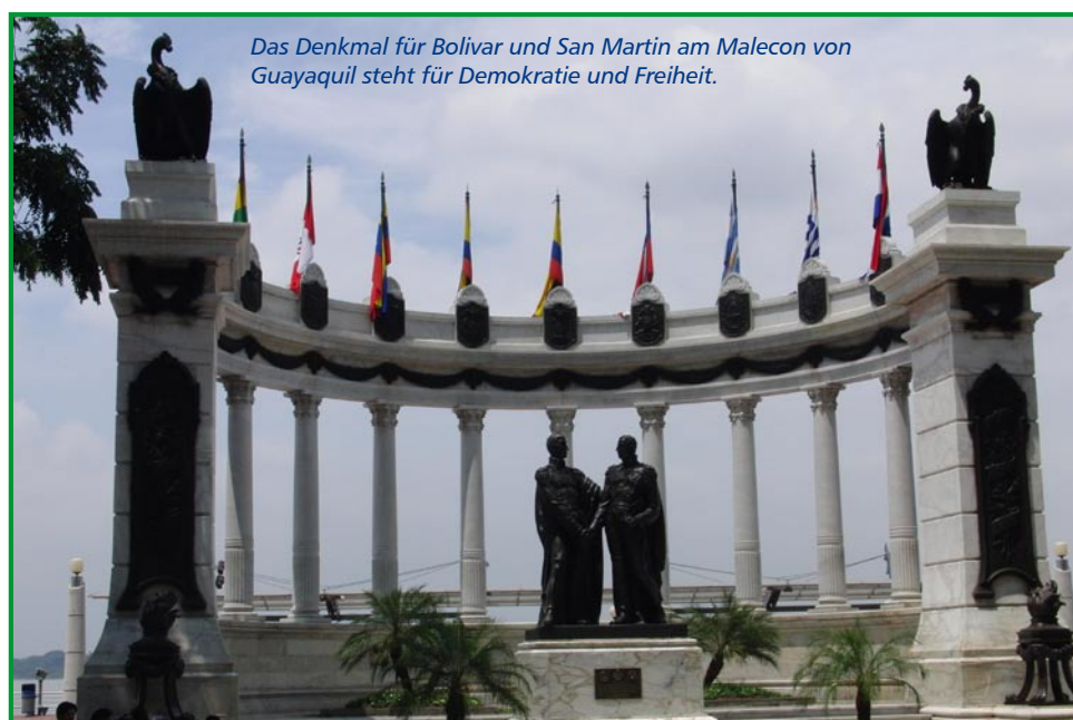
Das Denkmal für Bolivar und San Martin am Malecon von Guayaquil steht für Demokratie und Freiheit.

„Zu politisch-ideologischen Aspekten halten wir als Kammer Distanz, wir interpretieren die Linie als nationalistische Politik zur Errichtung einer klassischen sozialen Marktwirtschaft.“