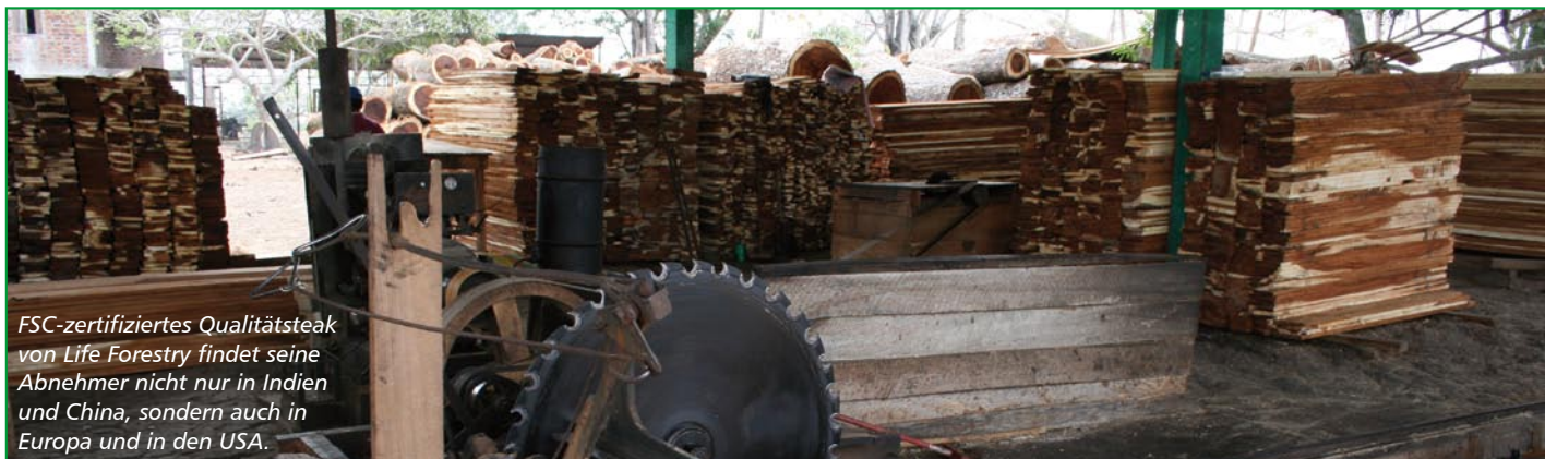
FSC-zertifiziertes Qualitätsteak von Life Forestry findet seine Abnehmer nicht nur in Indien und China, sondern auch in Europa und in den USA.

Wer Teakbäume der Life Forestry Group erwirbt, der leistet einen wichtigen Beitrag für die Umwelt und den Schutz des Regenwaldes. Doch auch die Aussicht auf eine langfristig interessante Rendite ist natürlich eine starke Motivation. Die Life Forestry Group legt dabei grossen Wert auf Transparenz und veröffentlicht sehr detailliert seine Renditeprognosen. Diese basieren auf der erwarteten Holzmenge und den Holzpreisen. Während die Qualität und Menge des Teakholzes über jährliche Gutachten und Inventarios als abgesichert gilt, stellt sich bei manchem Kunden die Frage, wie es mit den Erlösen aus dem Holzverkauf aussieht. In der Tat gibt es noch keine echten Erfahrungswerte für 20-jähriges, FSC-zertifiziertes Plantagenholz.