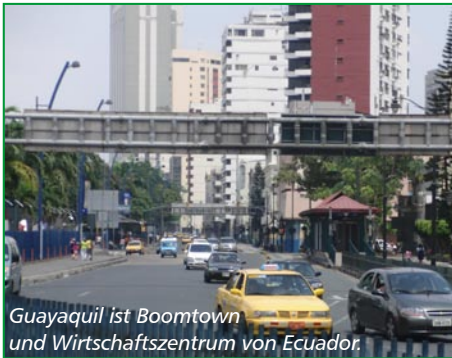
Guayaquil ist Boomtown und Wirtschaftszentrum von Ecuador.

Für ausländische Unternehmen spielt natürlich die Frage der Investitionssicherheit eine ganz wesentliche Rolle: „Prinzipiell gehen wir nicht davon aus, dass ausländische Investoren Probleme bekommen, die wie die Life Forestry Group in Aktivitäten investiert, die in Übereinstimmung mit den hie-