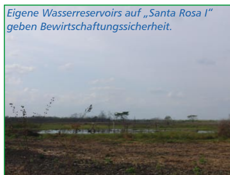
Eigene Wasserreservoirs auf „Santa Rosa I“ geben Bewirtschaftungssicherheit.