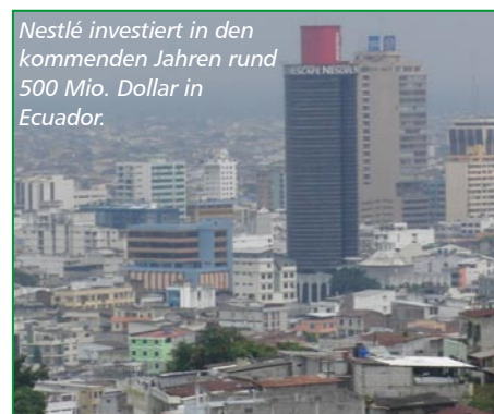
Nestlé investiert in den kommenden Jahren rund 500 Mio. Dollar in Ecuador.

„Bisher sehen wir die in Ecuador betriebene Politik wesentlich weniger extrem, als sie in der internationalen Berichterstattung interpretiert wird. Genauere Bedingungen und Details erwarten wir mit Inkrafttreten des o.g. Gesetzes, was eine Art Grundlage für alle wirtschaftlichen Aktivitäten in Ecuador legen wird.“ ■